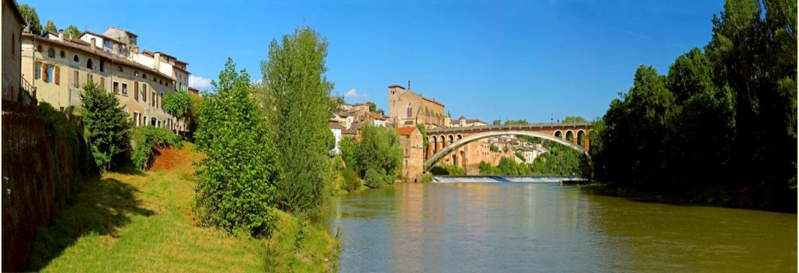
Gaillac, Quai Saint-Jacques (C)