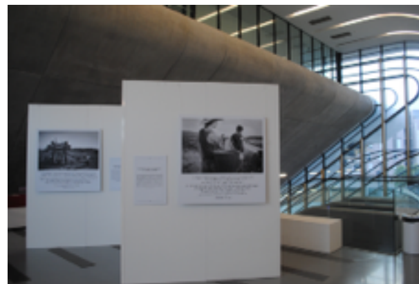
1 mois d'exposition à Pierresvives, la cité du savoir Montpellier