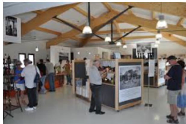
Scénographie de l'espace de vente