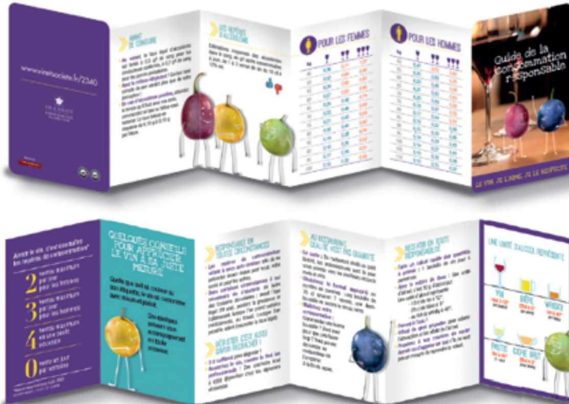
Guide de la consommation responsable

AU NOM DES 500 000 ACTEURS DE LA VIGNE ET DU VIN